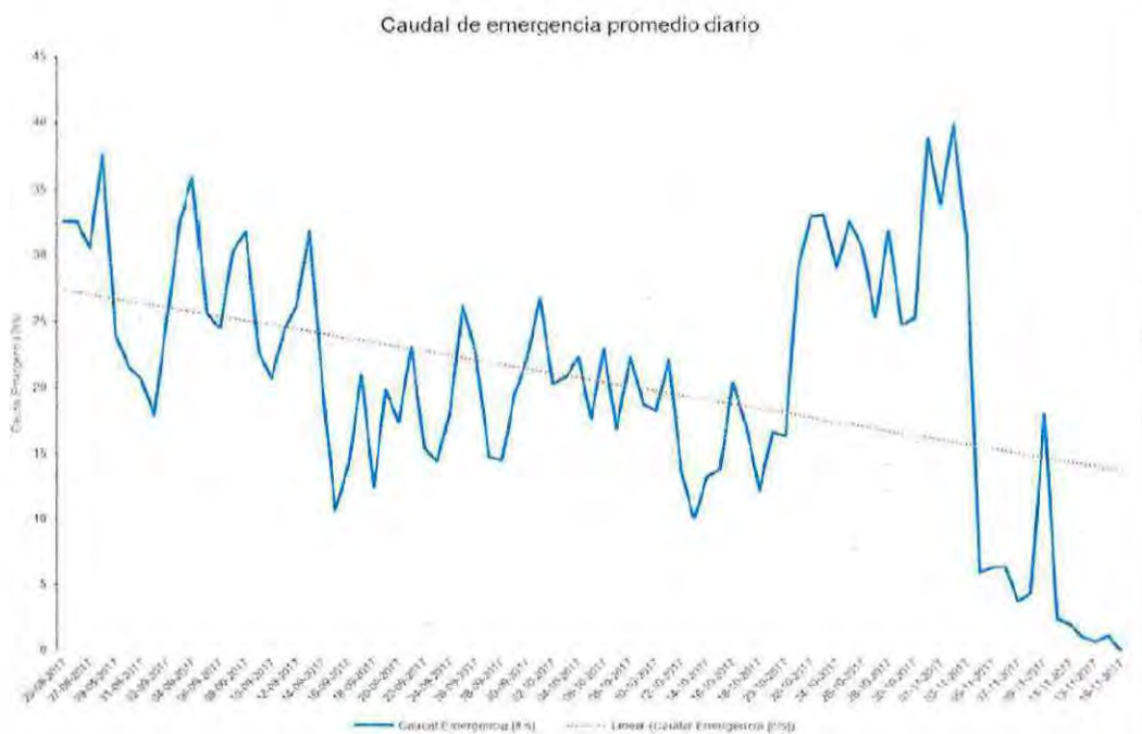
Gráfico N° 1 2 :

17. El 25 de agosto de 2017, mediante la Resolución Exenta N° 957, la SMA le requirió a la empresa una serie de antecedentes sobre la contingencia reportada. A su vez, el 30 de agosto de 2017, funcionarios de la SMA realizaron una actividad de fiscalización al proyecto para revisar en terreno el sistema de tratamiento de las aguas afloradas que están instaladas en el portal L1. Además, se realizaron mediciones de la calidad del agua superficial y se le solicitaron nuevos antecedentes a la empresa.